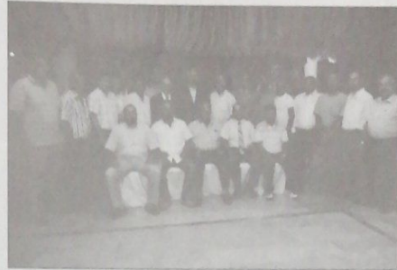
مسؤولي الأندية الرياضية مع رئيس وأعضاء الاتحاد