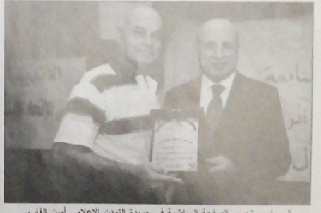
إلى رئيس تحرير الصلعة الرياضية في جريدة للتعدين الإعلامي أمين القاري