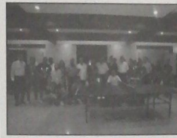
صورة جامعة للفائزين مع الحكام واداري البطولة