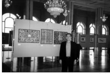
الفنان رياض عويضة