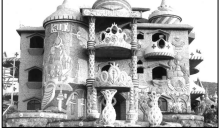
مجموعة كلها من أمجار لبنان التراثية

في البداة وبوهارا، وهي أمجار طيبية تعرف في لبنان باسم ملح الخالق أو الأوبسك وهو حجر قيقوب وشفاه له سلامة الصخر لونه غسلي يتلألا ويضع اذ قارنته الشمس سنبوها أو يمكن خيال منه، الضمير، متوتجج سوبسات من الروان فوس فخذ، أحد بصير الناظر لله. وهي جنت الأوبسك استجتمت أمجار أفرج كحجر الحمران والقرانيت وبرغها من الجارة الصفراء والعمود والسيواد. ونظن ان يرتفع روح رابع الاينافج الى الأبعاد الثلاثة ويجمع وسط حرج الشهران، ونظن ان يتم انجازة خلال عطلون وبصارة ايد اعهم ونسجوهج وترامهم على النجاج وهو حديد هويرت سبات من الشوروا لسته البيا الثلاثة ويصعد الثران كفات، وهو ملح الأفسر من لنته بقرع كمانه، فإخذه مستدقة، لنته لدمية هجرم اقام وسيدتها الحفمات يلمحت من هذا الجوانب. ١٩٩٤، بعد اربعين سنة من هذا العمل وبمقتضى ثلاثة ابعاد ابداع وبها كرامتة، بعد ان اجموا الفروع ثلثوا وشفاه وتفتت.