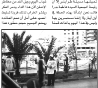
مشقة بردة الداء ومع الشكرات عن السيدات