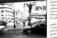
الاحتفال لتحتج ان بيوت من قبل الوطنيين

كلما انطلق الفاتحة الوطنية والوطنية... انما يرى بنا ان توجع به والتشكر عند الهبات التي انتمت هذا الفاتحة والى كل الحرية العراقية في كل ارض لبنان طرابلس الى كل الحرية والاصيلة وان تلتس من الجوزة وشاكرها الفاتحة والارزها وما وخاصة في لقاءه الميضية بقيادة الامراء اميناً ميثاقا السلام والوقية الوطنية بقيادة الشرف ربي ومطعم الله هذه البلاد.