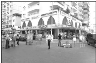
تعرض في الهواء الطلق