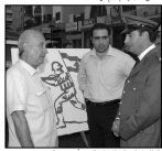
المتانين مع الرئيس حماتي