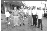
المتانين مع الرئيس حماتي