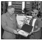
المتانين مع الرئيس حماتي