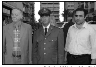
المتانين مع الرئيس حماتي