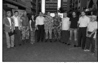
المتانين مع الرئيس حماتي