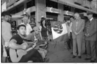
مركز سمر خضادة مع العرض