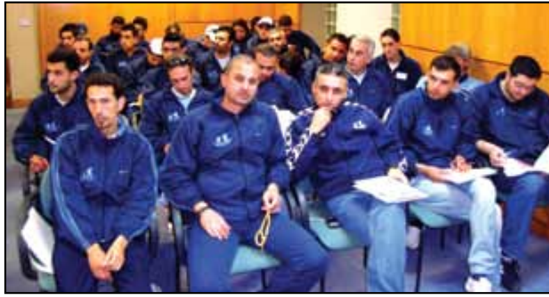
اداري اندية ccpa في الشمال يشاركون بمحاضرة في المدينة الرياضية