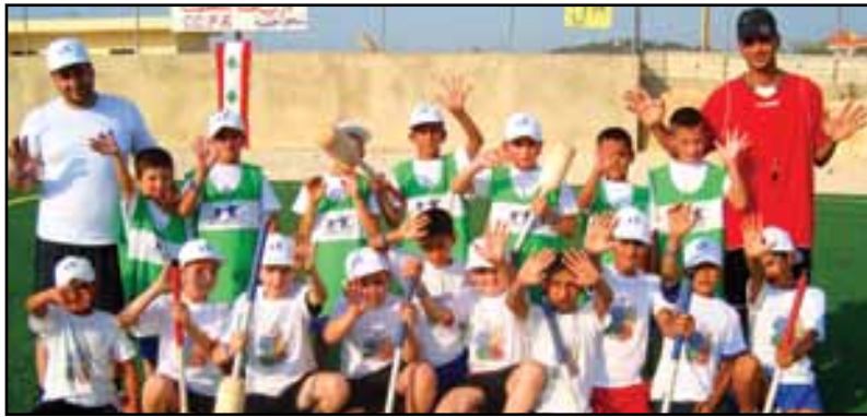
الاطفال المشاركين في مخيم عكار