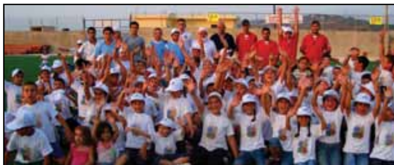
اختتام المخيم الرياضي في منطقة وادي خالد - عكار