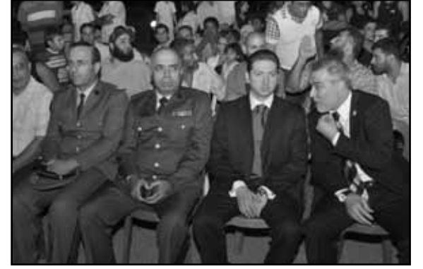
الوزير فيصل كرامي مع ممثلي الوزراء ورئيس الاتحاد