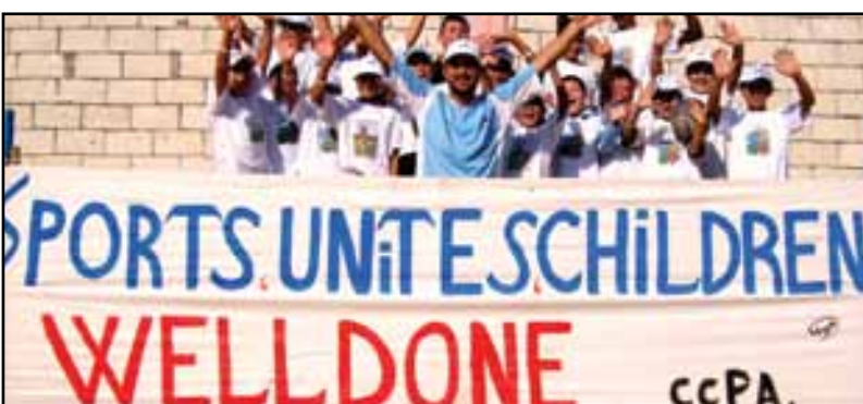
اطفال المخيم يشكرون الجمعية