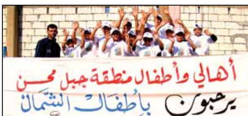
اطفال المخيم يشكرون جمعية ccpa