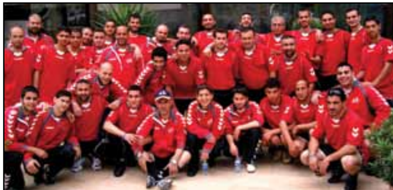
مدربي اندية ccpa يخضعون لدورة تدريبية في فندق ladje في بيروت