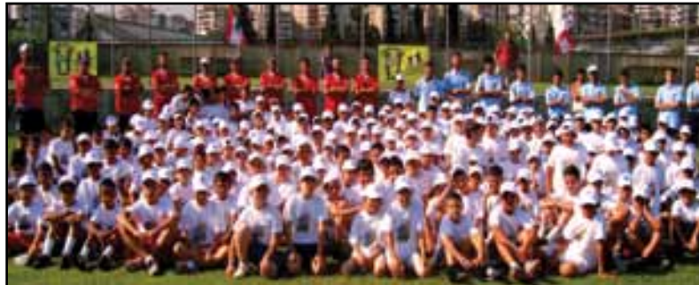
اختتام المخيم الرياضي في الملعب البلدي في طرابلس