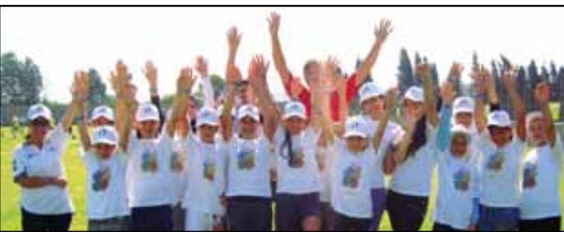
الصبايا المشاركات في المخيم