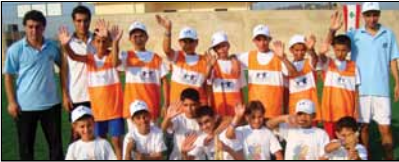
الاطفال المشاركين في مخيم الضنية