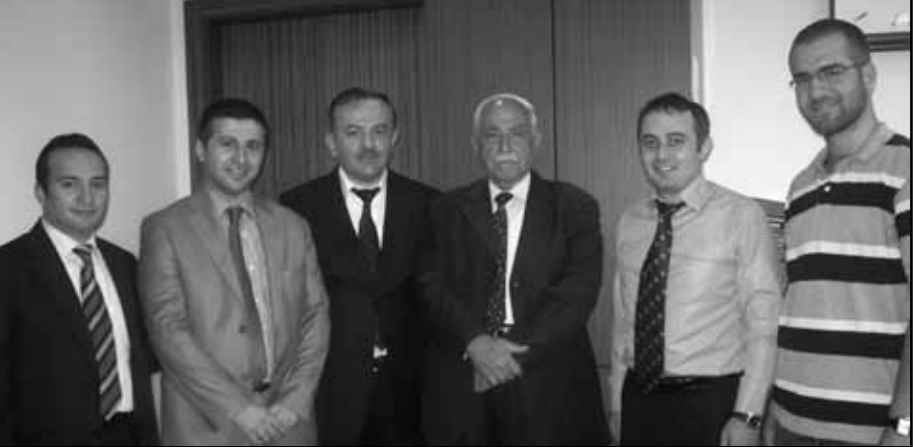
مدير مكتب نائب رئيس بلدية اسطنبول

اكاديمي اسطنبول ادم فاريجي، مدير مكتب نائب رئيس بلدية اسطنبول، ونائب رئيس مؤسسة شباب الاناضول ورئيس العلاقات الخارجية شيرافان مولوغلو، مدير منظمة المؤتمر الاسلامي - مركز الابحاث للتاريخ والفتن والثقافة الاسلامية خالد ابرين، ومحمد اينال مدير إحدى كبرى الشركات في بورصا، كما شملت الرحلة ايضا زيارات للمتاحف والمزارات وعدد من الاماكن التاريخية والآثرية وقد حضر الضابط ومرافقه حفلة لفرقة التراث العثماني اقيمت في قصر توبياكي كما زارا اقرباء الرئيس التركي السابق عصمت اينونو في بورصا الذين قاموا باستضافتهم ليلتين. وكانت وزارة الثقافة والسياحة التركية قد تكفلت بكامل تكاليف الرحلة وكان الضابط قد قدم للرئيس رجب طيب اردوغان ولوزير الخارجية احمد داوود اوغلو ولوزير الثقافة والسياحة ارتوغور غوناي وللوزير فاروق تشيليك صورا تذكارية لتسببه الرئيس التركي السابق عصمت اينونو.