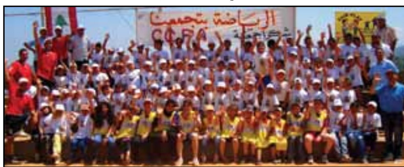
اختتام المخيم الرياضي في منطقة حرف سياد - الضنية