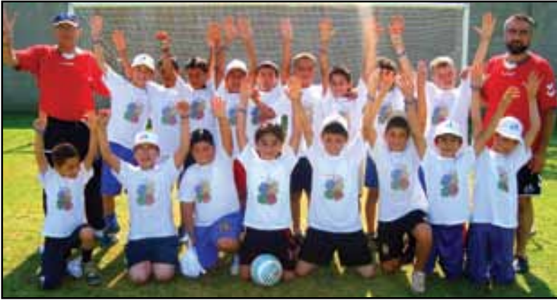
الاطفال المشاركين في مخيم طرابلس