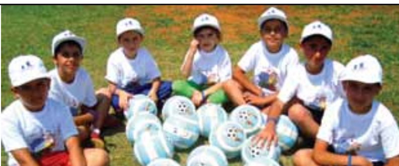
الاطفال يتجمعون حول كرة القدم