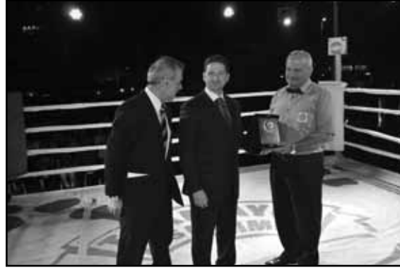
ودرعا اخر للحكم