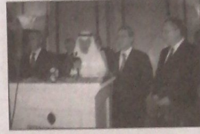
السفير القطري سعد بن علي المهندي بأفي كلمته