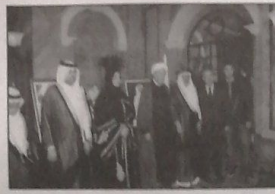
وممثل حزب الله