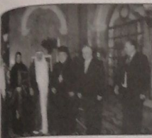
وسيدة المطران والوزير الياس حد