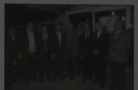
فتحت كمارك الراجعي وبارودي