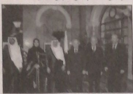
السفير القطري سعد بن علي المهندي مستقبلاً الرئيس حسين الحسيني والوزير صلوح