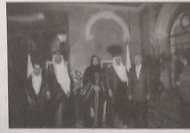
والوزير عدنان السيد احمد