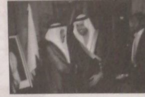
وسفير دولة الامارات رحمة حسين الزعابي