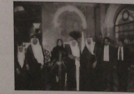
السفير القطري والسفير الاماراتي مع وفد من المغارة