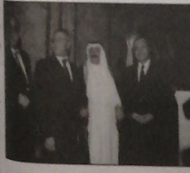
السفير القطري والوزراء الشامي ومزي