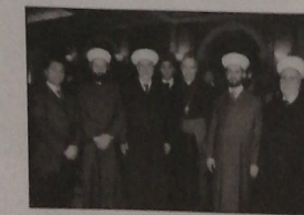
المفتي الشعار والسفير القباوي