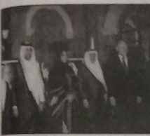
والوزير تمام سلمان