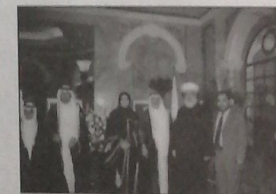
والمفتي عكار اسامة الرفاعي