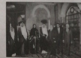
والشيخ حسن الشهاب