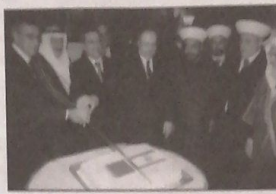
السفير القطري والوزير الشامي والنائب بزي والوزير مزي والشبح عريمط والمفتي الشعار بأعضاء نائب العلوي