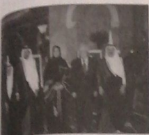
والوزير عدنان السعد

بحضور حشد من الشخصيات السياسية والثقافية والدبلوماسية