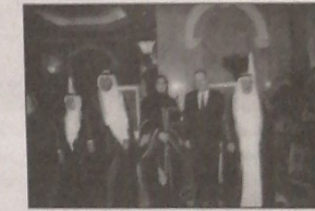
ووزير الاعلام طارق مزي