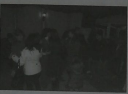
الحضور في المطعم