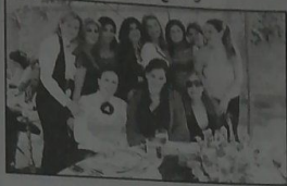
ومع بعض الصديقات