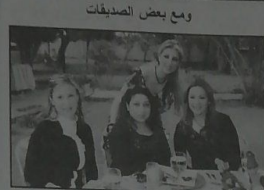
ومع علا ببيروت، ربي ابيوني ورائيا ملك